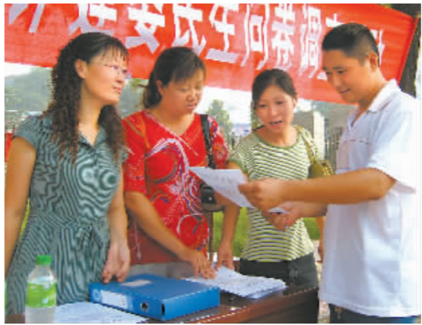
日前,中站区城建局组织工作人员进社区、入企业和在群众聚集的广场、商场等公共场所进行民生问卷调查。图为该局工作人员正在向过往群众讲解民生问卷调查表的填写方法。

本报讯 今年年初以来,中站区交通局以查处损害群众利益的行为为重点,以提高工作效率、让群众满意为目标,组织开展了政风行风评议进社区、进农村和进企业活动。活动中,该局广泛宣传法律法规,公开服务承诺,办事程序,走访了辖区200多家单位的2000名干部群众,广泛征求意见和建议。截至目前,该局已全部解决问题的同时,又为群众办好事实事9件,受到了群众的好评。(李超)