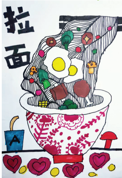
●司若依 Jy2011160 解东一小二二班