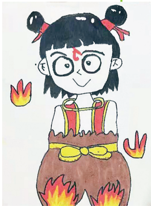
●吴宗泽 Xs12010024 学生路小学二二班