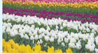
3.荷兰小镇斯哈亨的郁金香花海