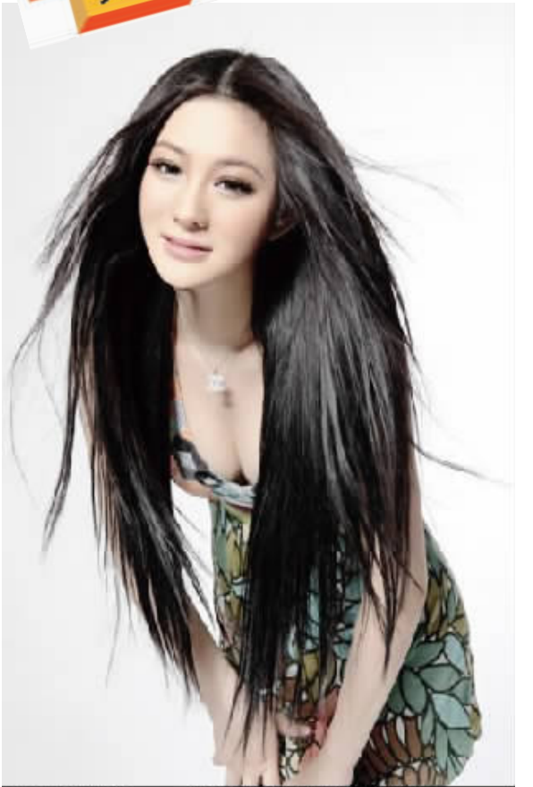
看美女,到微辛 微来美女网: www.vlike.com