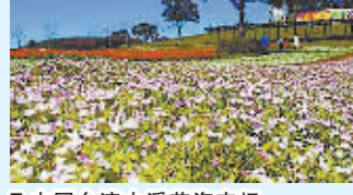
7.中国台湾大溪花海农场