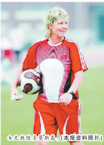
女足教练多曼斯基。