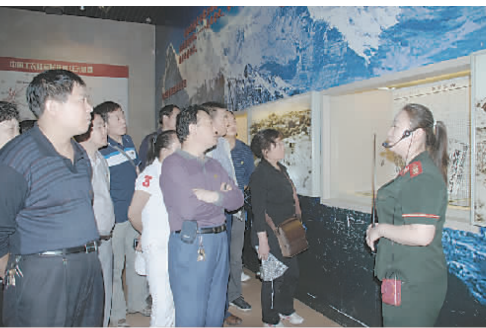
为庆祝中国共产党成立90周年,近日,市第五人民医院组织全体党员干部和员工代表走进革命圣地延安,学习延安精神、重温党的历史、接受革命传统教育。图为讲解员正在延安革命纪念馆为大家讲述红军长征史。