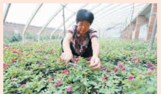
辖区内特色农业花卉种植