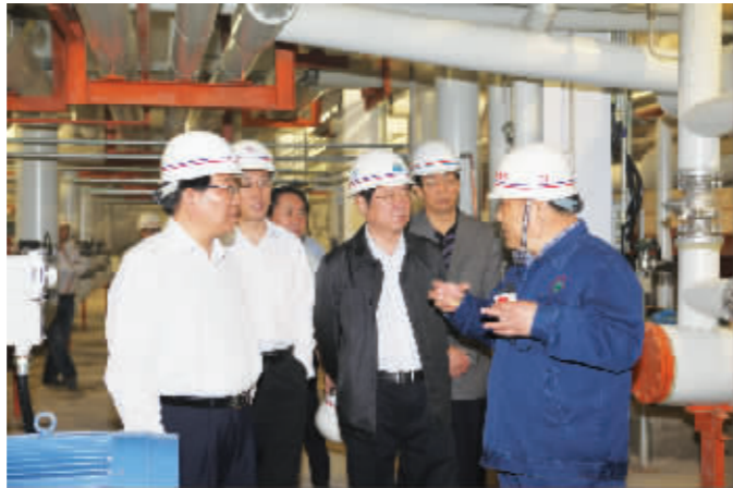
市委书记路国贤(中)和市、区有关领导在焦作卓林数码材料有限公司调研。

2000年5月29日,修武县李万乡划归焦作高新区管理;2004年7月20日,李万乡分为玉溪、碧莲、南海、丰收四个管理处;2007年4月20日,四个管理处合并为李万、文苑两个街道办事处,至此,李万街道正式成立。目前,李万街道占地总面积约24平方公里,耕地面积约1.3万亩,迎宾路、世纪大道、民主路、西环路等市、区主要道路经过辖区,辖区共11个行政村,总人口约1.3万人。其中农业人口1.1万人,非农业人口0.2万人。中轴集团、卓林数码、平光制药、北大附中、江阴凯立德、东方今典等项目先后落户该辖区。