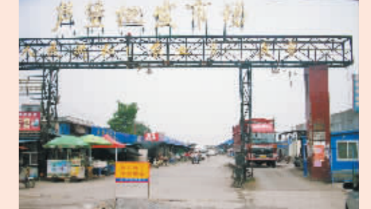
日臻完善的芦堡蔬菜批发市场