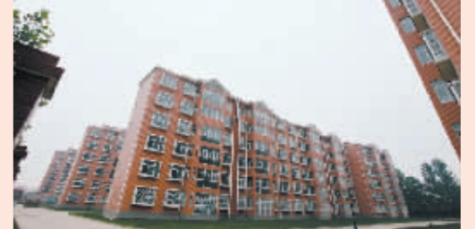
崭新气派的村民安置小区