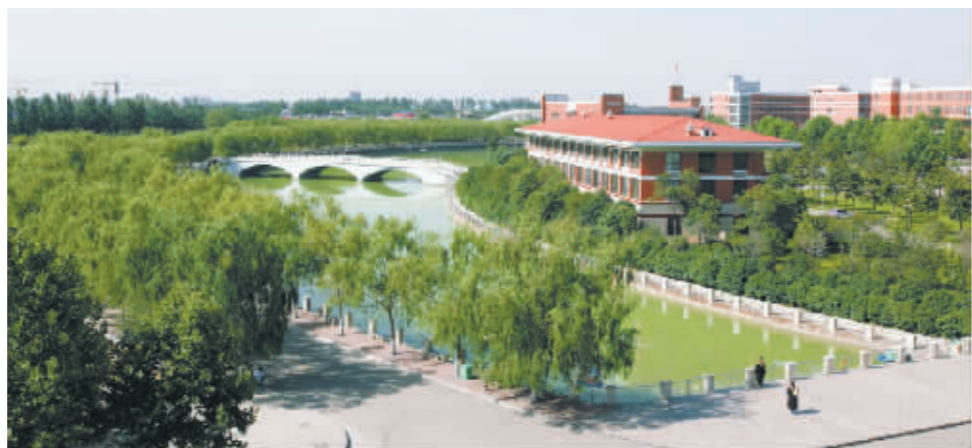
河南理工大学优美的校园风景