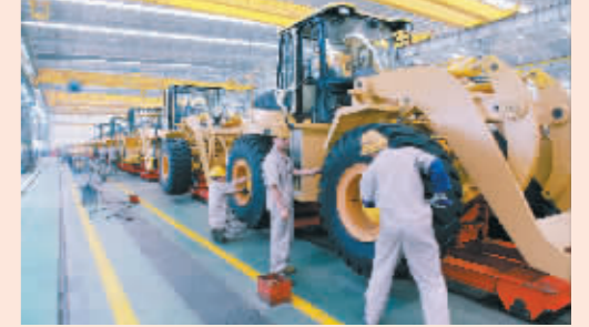
厦工装载机流水线生产