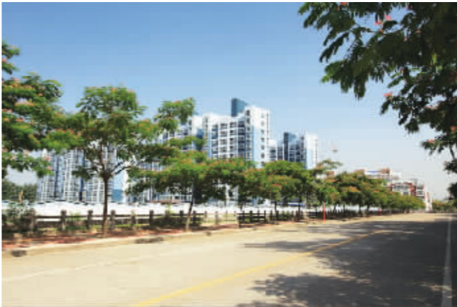
今日的李万,优美的环境,宽敞的马路,整洁的街道。

2007年,对李万街道来说,是具有历史开创性的一年。这一年,李万街道正式成立;这一年,李万由原来的偏远农村乡镇转变为高新区中心城区街道办事处;这一年,李万街道开启了新的发展旅程。五年来,李万街道犹如一只展翅翱翔的雄鹰,裹挟着发展的希望,集聚着辉煌的能量,在历史上书写了浓墨重彩的一笔。