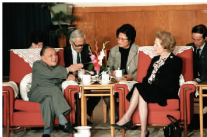
1984年12月19日,邓小平在北京人民大会堂会见英国首相玛格丽特·撒切尔。这一天,中英两国正式签署关于香港问题的联合声明,英国政府于1997年7月1日把香港地区交还中国政府,中国恢复对香港地区恢复行使主权。80年代初期,邓小平提出“一国两制”的伟大构想,是中国特色社会主义理论的重要组成部分,为实现祖国和平统一大业开辟了切实可行的道路,也为国际社会以和平方式解决历史遗留问题和争端提供了崭新的思路。