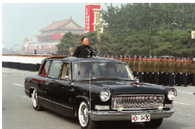
1984年10月1日10时,庆祝中华人民共和国成立35周年庆典活动在天安门广场举行。图为中央军委主席邓小平检阅中国人民解放军受阅部队。