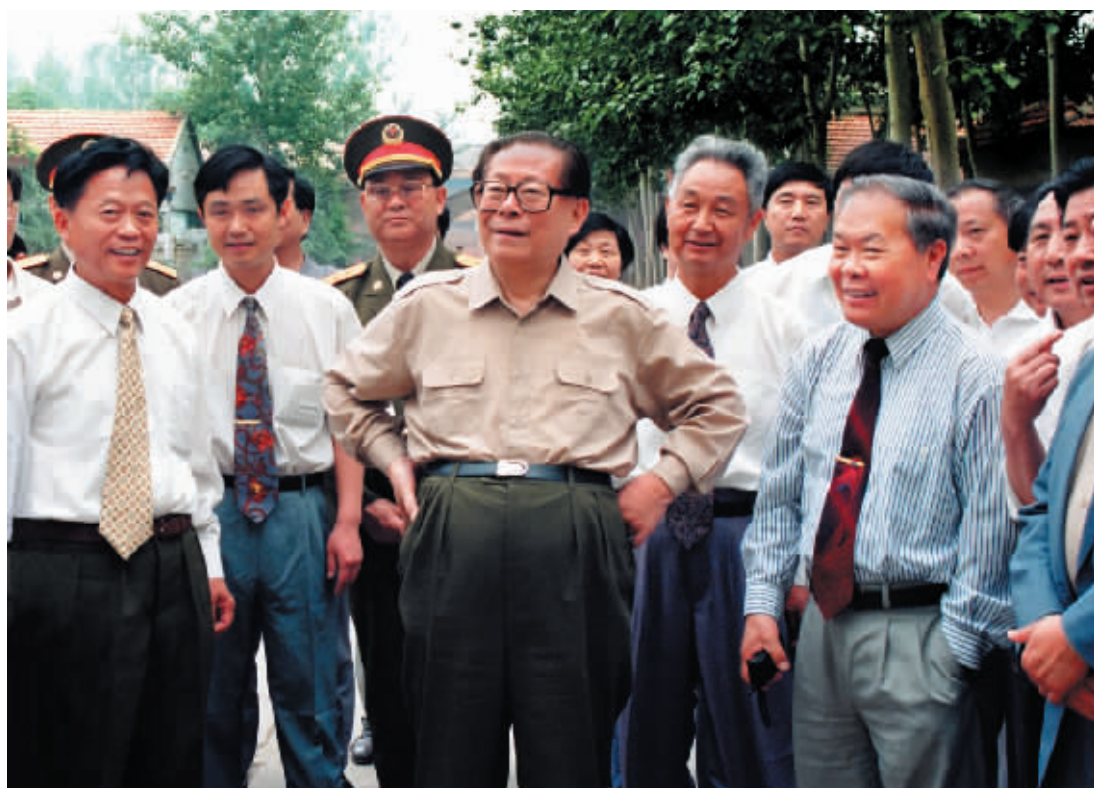
江泽民同志1996年6月3日在博爱农场视察。

1990年4月18日，党中央、国务院作出开发开放浦东的重大决策。截至1999年，名列世界500强榜首的世界企业巨头中已近百家在浦东投资。这是1999年9月6日，上海通用汽车有限公司的工人正在生产线上组装“别克”轿车。