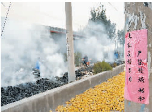
9月25日下午,在马村区待王街道王母泉村口,在“严禁焚烧秸秆”的标语前,正在燃烧的玉米秸秆冒着浓烟,遮挡住了行人的视线。