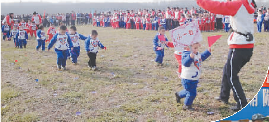
日前,在中站区生态园里人声鼎沸、笑声如潮。该区快乐实验幼儿园举办的第三届冬季亲子运动会在这里举行。这次运动会以“冬天来了”为主题,小运动员们在充满乐趣的运动中,既锻炼了身体,又培养了勇敢的品质。

本报 为进一步提高学校党支部的凝聚力、充分发挥党员在提高教育质量方面的模范带头作用,近日,中站区教育局党委举行了党支部书记讲党课活动。 全区教育系统18家党支部分别围绕如何积极推进创先争优活动、深入开展党员志愿服务活动、扎实开展“三个干什么”实践讨论活动等党建方面工作情况,进行了脱稿演讲,由局领导班子和各股室长为每一位党支部书记评分,最后按照平均分排出名次。 近年来,该局党委高度重视和大力支持党建工作,不断加强和改进党的思想、组织、作风和制度建设,把党建工作和教育教学相结合,发挥党支部的战斗堡垒作用和广大教师党员的先锋模范作用,创造性地开展教学工作,推动教育教学质量的提高。 (刘飞)