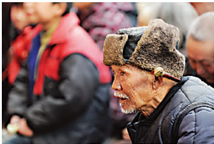
戏迷众生相

她说着脸上的笑让人羡慕,我提议给他们三口之家合个影。他抱起孩子,她挽着他的胳膊。在我摁下快门的一瞬间,他们笑得比身后浓放的桃花还要好看。这笑告诉我,有时幸福仅仅是一句承诺而已,而这承诺的背后却是一个一辈子的付出。