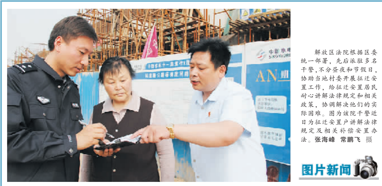
解武区法院根据区委统一部署,先后派驻多名干警,不分昼夜和节假日,协助当地村委开展征迁安置工作,给征迁安置居民耐心讲解法律和相关政策,协调解决他们的实际困难。图为该院干警近日为征迁安置户讲解法律规定及相关补偿安置办法。

编者点评:家长对未成年人有监护责任,如果监护不到位,有可能会承担损害赔偿赔偿责任。