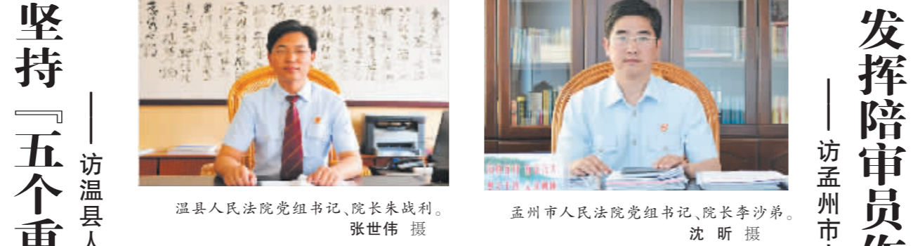
温县人民法院党组书记、院长朱战利。

“人民陪审员是法院联系社会的桥梁和纽带,发挥好人民陪审员在社会矛盾化解中的重要作用,对消除社会矛盾隐患,维护社会稳定起着积极作用。”基于这样的认识,孟州市法院党组书记、院长李沙弟日前表示,“在‘基层基础建设年’活动中,孟州市法院要进一步发挥人民陪审员的作用,更好地服务审判工作。”