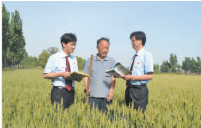
在“人民法官为人民”主题教育实践活动中,山阳区法院针对当前农村忙于农耕的实际情况,组织法官成立便民服务小分队深入农村田间地头宣讲法律,通过听民声、察民情、送法律、答疑惑,确保农民安心农耕。图为5月14日,法官正在地里为农民讲解法律知识。

●为进一步丰富老干部和法院干警的业余文化生活,营造浓厚的法院文化气氛,喜迎党的十八大胜利召开,近日,市中级人民法院组织开展以“诗书画影抒情怀”为主题的离退休干部摄影展,通过在离退休干部中征集诗词、书画、摄影作品,歌颂党的伟大成就,唱响新时代主旋律,为党的十八大胜利召开营造良好氛围。