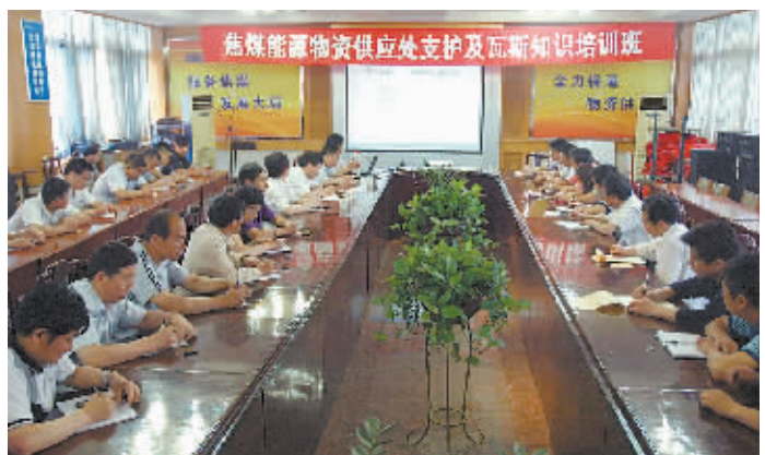
5月22日,焦煤集团支护及瓦斯治理知识培训在供应处开班,这次培训内容主要有井下支护管理、煤矿瓦斯突出防治体系、区域性治理措施等。袁爱民 摄

区安全防范教育活动,增强全员的自觉检查意识。同时,该公司还设立了群防专线电话,真正做到了及时发现、及时报告、及时处理。该公司结合自身实际,划分了四个防控区域,范围覆盖整个矿区。为将各个防控区的治安工作落到实处,该公司按照“谁分管,谁负责”的原则,安排专人负责各个防控区的治安工作,区域责任人不定进行检查。同时,该公司每月还对各区域治安工作进行对标考核,奖惩优劣。组织安全“预想网”。为了提前做好治安防范工作,该公司开展了“有奖隐患预想”活动,鼓励员工将自己在日常工作中听到、见到或想到的治安隐患提出来,做到防患于未然,推动了治安工作稳步发展,维护了矿区的和谐稳定。