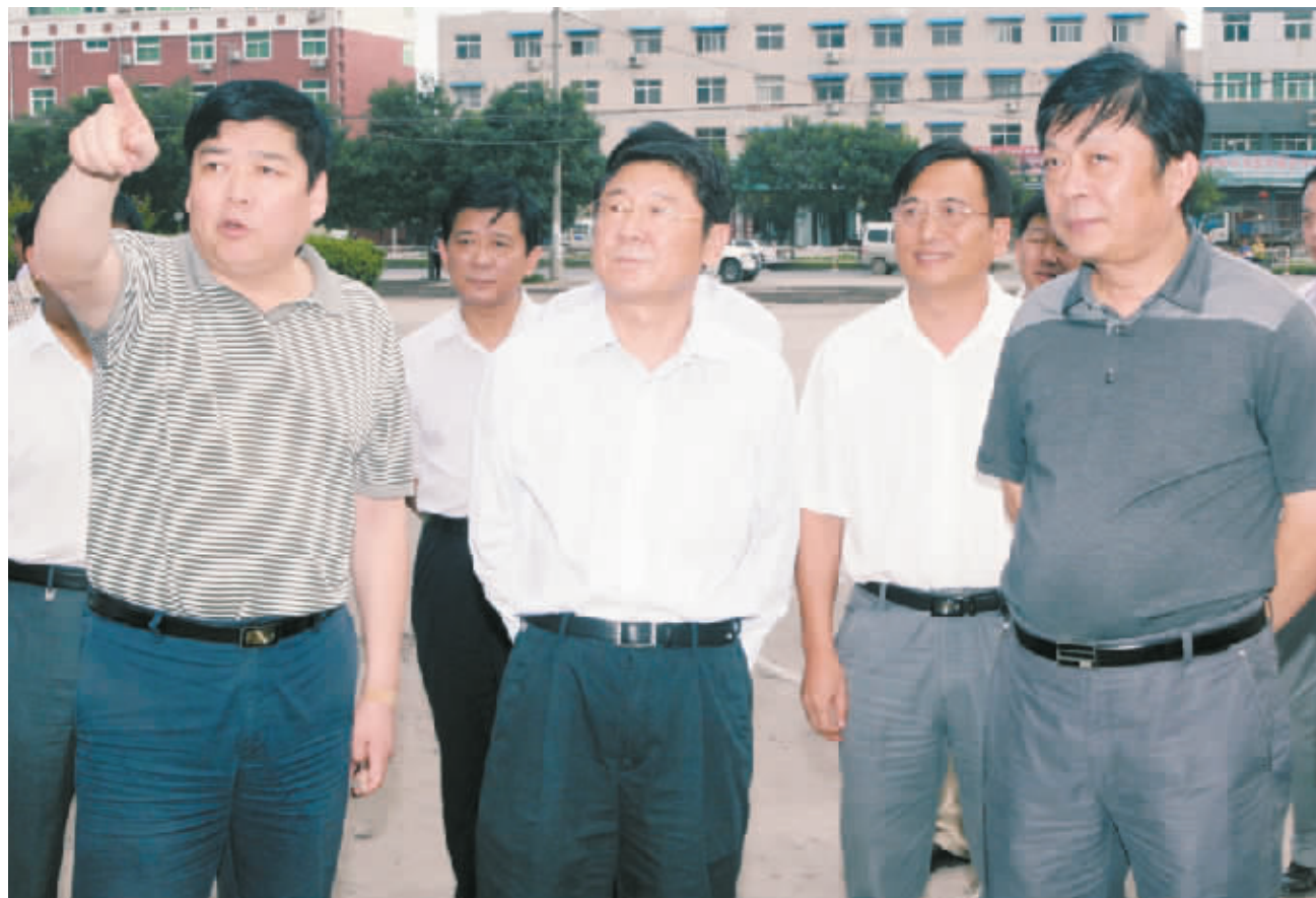
市委书记路国贤(前排中)在马村区视察城际铁路建设

引言 武城苍穹立周鼎,封神伐纣天下平。作为三十年前“粮食画报以改王师”之地,有着厚重历史的马村区在建设转型示范市的今天,以科学发展为主题,以转变经济发展方式为主线,坚持发展第一要务,以富民强区为中心任务,以新型城镇化带动“三化”协调发展,统筹兼顾,真抓实干,全区经济建设和各项社会事业都迈上了一个新台阶,为“十二五”发展奠定了坚实基础。截至4月底,全区固定资产投资完成7.2亿元,同比增长16.7%;规模以上工业增加值实现3.5亿元,同比增长3.4%;全区地区生产总值完成5.7亿元,同比增长2.2%;区域规模以上工业增加值实现2.2亿元,同比增长47.4%。 如今,该区域郊农业、林下经济发展方兴未艾,以铝配套及铝加工、装备制造、医药、汽车零部件、纺织等五大主导产业为主的现代工业体系逐步成型,城镇化步伐进一步加快,第三产业整体水平明显提高,南水北调征迁圆满完成,各项社会事业步步登高,人民生活明显改善,社会大局保持稳定,一个以新型城镇化为引领,以工业为支撑,以农业为基础、“三化”协调发展的活力马村已初步呈现在世人面前。