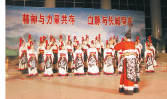
马村区女子合唱团在演出

古老而年轻的马村区,有着一个成就非凡、令人自豪的昨天,正处在一个生机勃勃、蒸蒸日上、也将拥有一个前景广阔、更加美好的明天。如今的马村区,遍拂科学发展的春风,正疾行在赶超超位的征程上。在区委、区政府的带领下,全区人民正以更加澎湃的激情和无愧于时代的业绩,共同谱写改革转型的新篇章,携手创造科学发展的新辉煌。