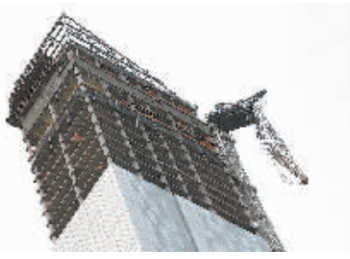
纽约曼哈顿57街,一座正在建设中的豪华住宅楼顶的起重机吊臂在飓风中折断。

“要回家得等政府派推土机把沙子推走,如果我还有家可回的话。”她说。玛丽居住的阿巴西肯大道附近地区30