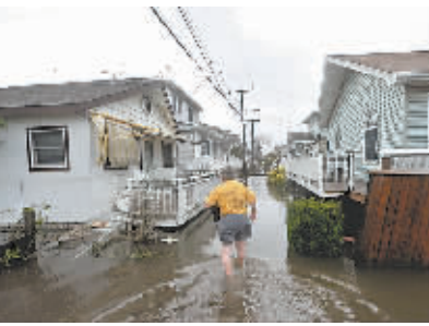
纽约皇后区变成一片泽国,供电中断,房屋受损,树木被飓风连根拔起。

日被警方彻底封锁,连媒体车辆都不让通行。玛丽可能得等上一段时间才能回家。新泽西州州长克里斯·克里斯蒂30