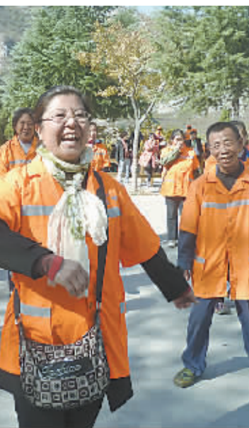
为了让环卫工人劳逸结合,放松心情,我市于 10 月 31 日至 11 月 6 日期间,组织部分一线环卫工人到青天河风景区旅游。图为环卫工人在景区里载歌载舞。

据了解,公共服务推行市场化运作,是政府将自身承担的一些公共服务行为交给有资质的社会组织来完成,目的是提高服务效能。对于商户被垃圾堵门的问题,宋振伟说商户不应该不缴卫生费,商户被垃圾堵门是公司 and 商户之间的事,应该由他们自己协商解决。截至 11 月 1 日 16 时,垃圾堵门问题依然没有解决。