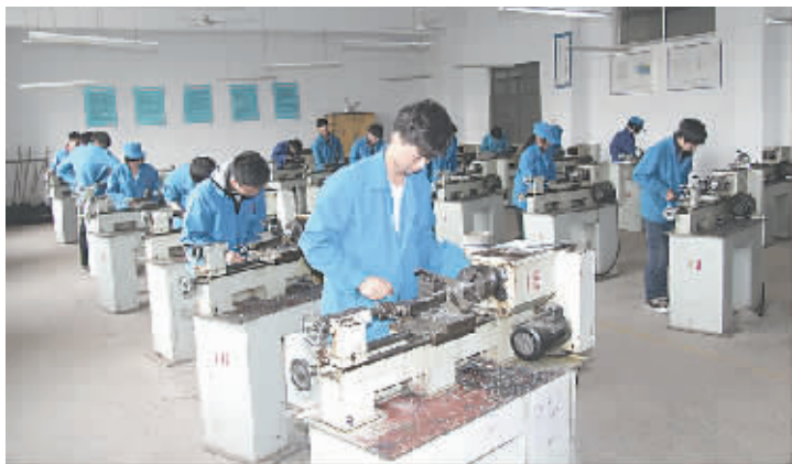
近日,市技师学院为提高学生技能水平,举办了高技工班学生技能大赛。图为该院数控车工专业学生竞赛现场。