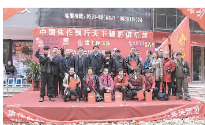
图为到场嘉宾和获奖选手合影留念。