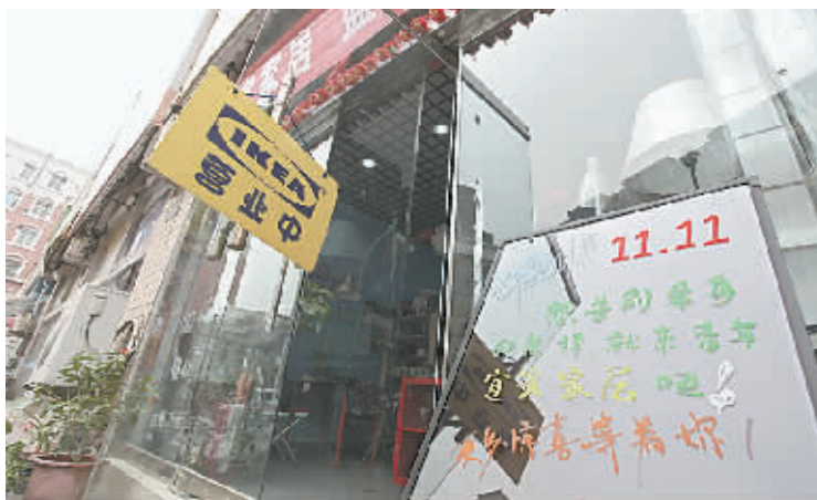
市内某店面的“双十一”促销活动。