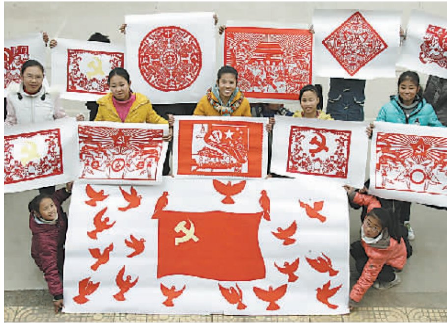
11月8日,温县北冷乡初级中学的学生在展示自己制作的剪纸系列作品《庆祝十八大》。近日,该校剪纸兴趣小组的同学们精心创作了一组以“庆祝十八大”为主题的剪纸作品,表达对党的十八大的企盼和对国家欣欣向荣的祝福之情。