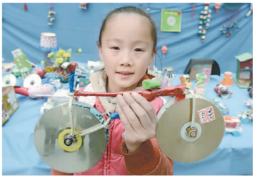
11月20日,沁阳市实验小学举办“废品再利用,垃圾也美丽”手工制作大赛展览,展出了学生们用易拉罐、塑料瓶、泡沫、海绵、纸张、毛线、布条等生活中废弃物制作的手工艺品。

据了解,我国《道路交通安全法》第四十三条规定,机动车行经铁路道口、交叉路口、窄桥、弯道、陡坡、隧道、人行横道、市区交通流量大的路段等没有超车条件的,不得超车;第四十五条规定,机动车遇有前方车辆排队等候或者缓慢行驶时,不得借道超车或者占用对面车道,不得穿插等候的车辆。