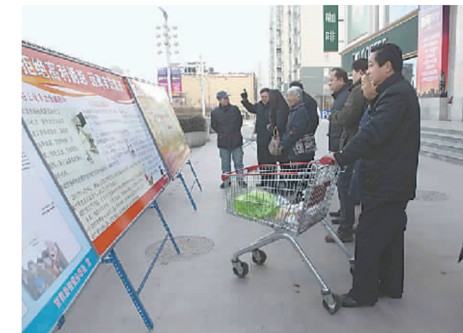
新山阳商城大型灯展受青睐

活动;建立流动人口一人一卡管理档案,安排专人根据流动人口不同岗位特点不定期进行随访,帮助他们解决实际问题;建立了两个人口计生服务站,承接B超健康查体、妇科病诊治和生育手术审核等“一条龙”服务系统。去年以来,该街道共为辖区312人建立起流动人口管理档案,举行专题培训6次,帮助群众解决实际问题106个。(刘渝方)