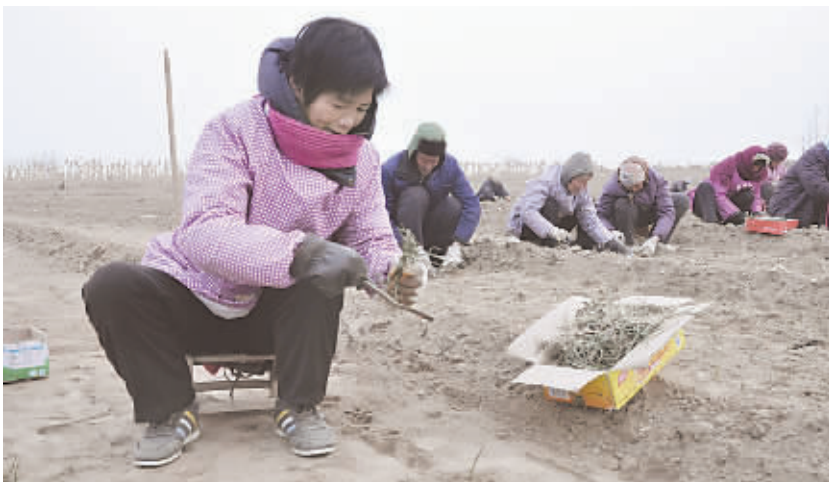
1月5日,在孟州市西魏镇成楼村,通和蔬菜合作社的工人们正在移栽洋葱苗。该合作社这次移栽的洋葱苗种植面积有一百余亩,所产洋葱在正常情况下预计5月份可上市。