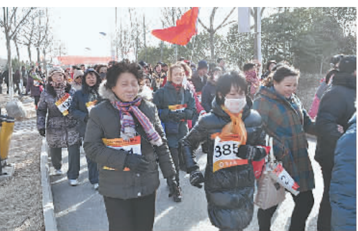
新年伊始,山阳区文体局与市体育局在缝山公园共同举办了迎新年登山活动,我市有一千多名群众参加了此项活动。