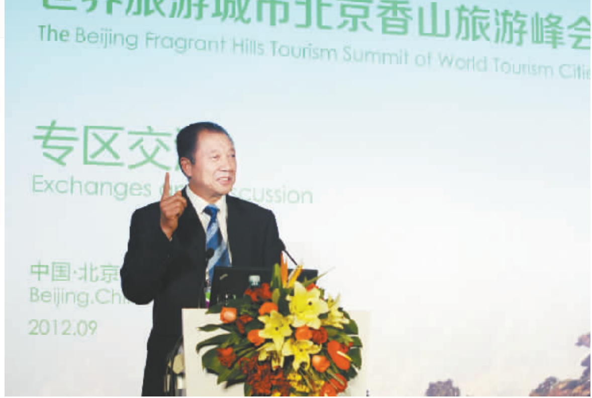
市委副书记、市长孙立坤出席世界旅游城市联合会成立大会并与其他城市会员代表一起签署《北京宣言》,标志着焦作旅游从此登上国际旅游舞台。