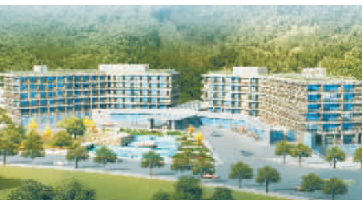
我市旅游景区品质全面优化提升,云台山旅游综合服务区首期工程云天阶五星级度假酒店项目工程主体结构完成。