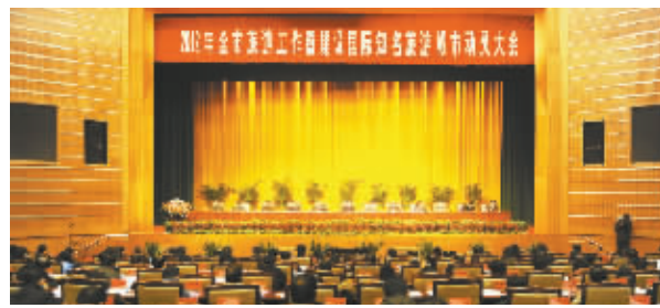
2012年3月22日,市委、市政府组织召开高规格的建设国际知名旅游城市动员大会。