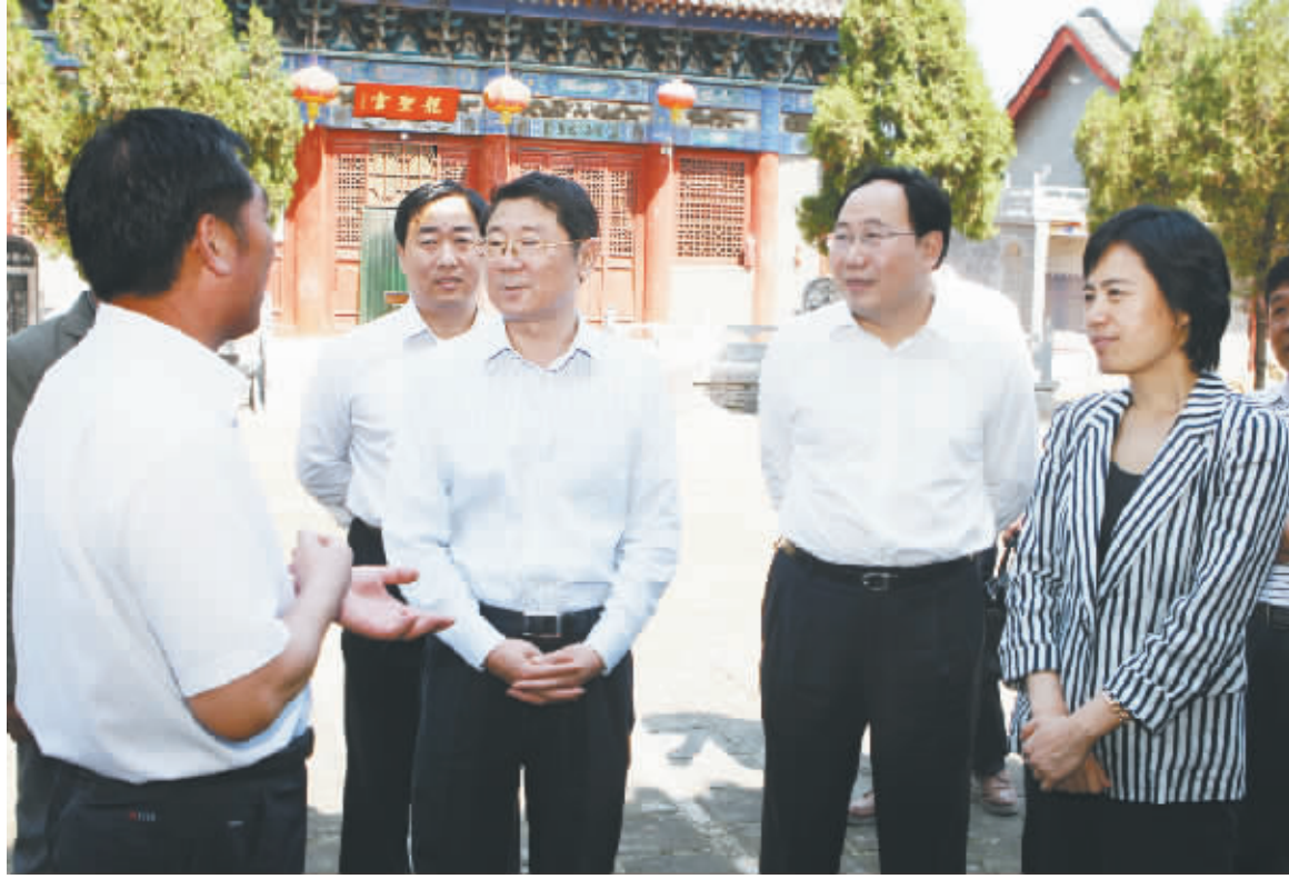
市委书记路国贤(右三)等领导调研我市文化旅游工作。