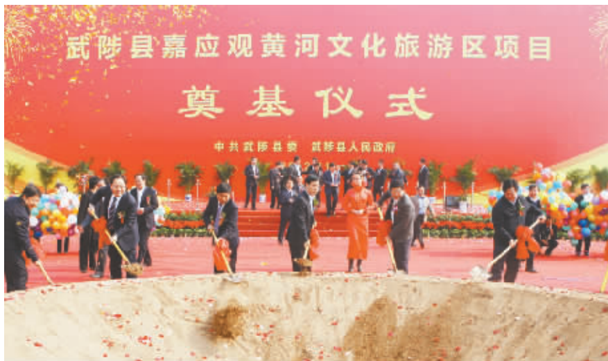
2012年,全市旅游项目建设共投入资金13.57亿元,有力支撑旅游转型升级。