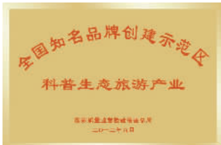
云台山景区在精细化管理、规范化建设方面成绩斐然。