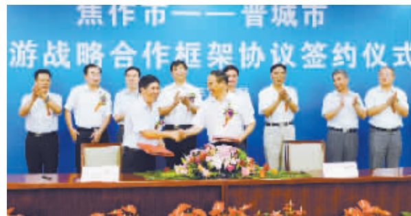
我市区域旅游融合发展开创新局面。