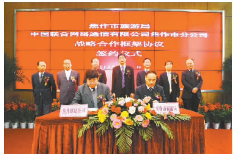
全市开展“数智旅游”旅游信息化项目建设,拉开了建设“智慧旅游城市”的帷幕。