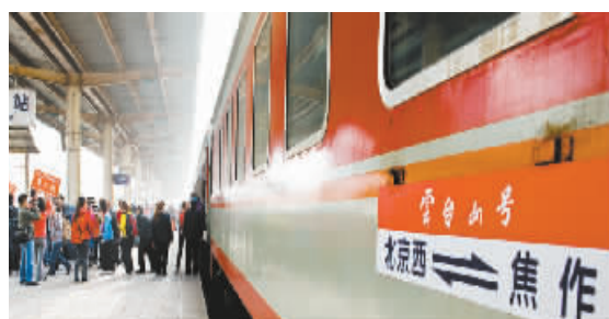
2012年,64列次(架次)旅游专列(包机)次第开来,8月至9月试运行的北京至焦作双向始发列车趟趟爆满,高端客源市场开拓成效明显。