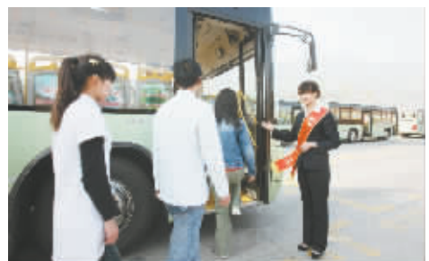
狠抓培训,导游素质和服务技能进一步提升,导游员社会保障体系进一步完善。