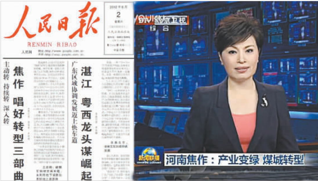
围绕焦作建设中原经济区经济转型示范市和建设国际知名旅游城市,2012年,中央主流媒体集中连篇热议。