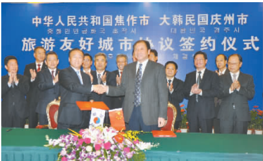
2012年11月5日,焦作与韩国庆州市缔结为“旅游友好城市”,这是焦作历史上首次与境外城市建立旅游友好城市关系。