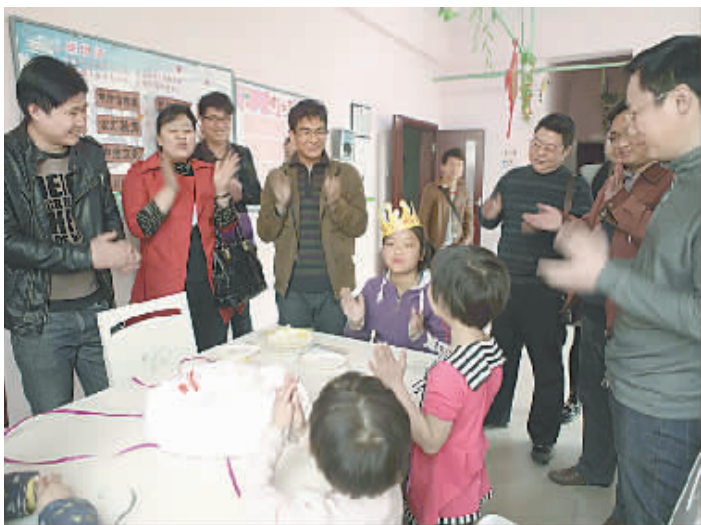
近日,山阳区委宣传部和区文明办的志愿者在市儿童福利院为一名孤儿过生日。当天,该区志愿者还为院里的部分孩子赠送了学习用具,让这些孩子感受到了浓浓的爱意。