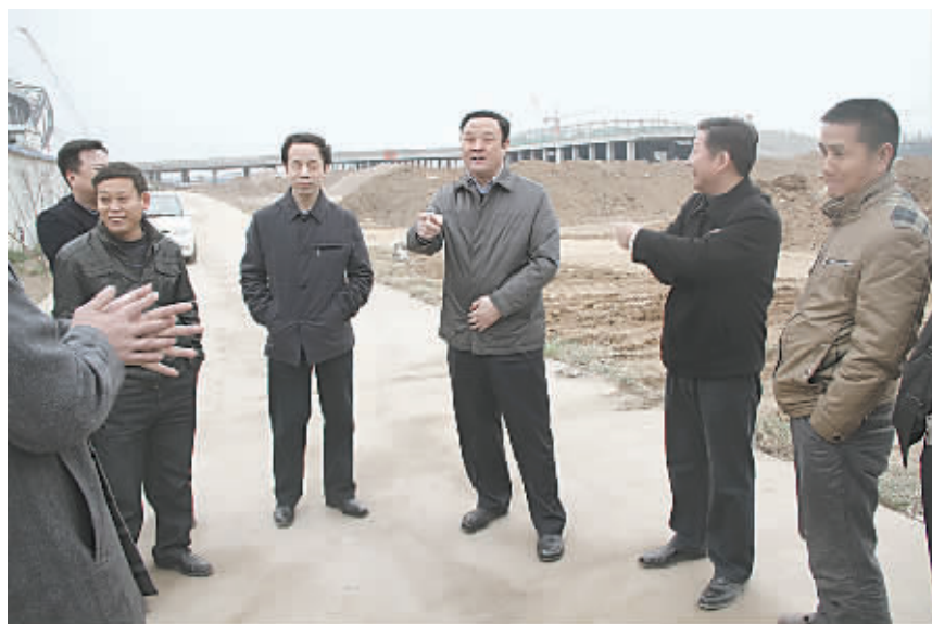
3月11日,山阳区委书记孟令武(右三)到辖区建设项目现场调研。当天,孟令武在市体育中心项目建设工地主持召开由区直有关部门和街道负责人参加的现场办公会。他要求,区直有关部门和街道要采取得力措施,加强与群众的沟通和交流,有效地推进拆迁工作,确保按市里的要求完成既定目标任务。