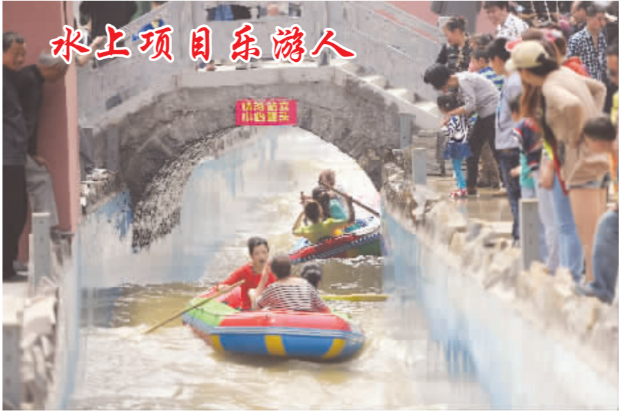
5月1日,游客正在畅享人工造浪带来的快乐。当天,国家AAAAA级景区神农山投资3500万元的大型水上娱乐项目欢乐岛正式投入运营,为游客消暑避暑、休闲娱乐提供了又一美好去处。

建设中原经济区经济转型示范市,光荣的使命鼓舞着我们无私无畏、奋发有为,必胜的信念激励着我们顽强拼搏、开拓进取。让我们甩开膀子、振奋精神,乘风破浪、克难攻坚,把美丽焦作这艘巨轮驶向更加开阔的水域!