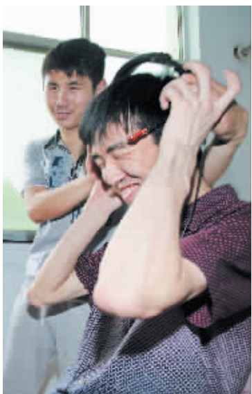
录音乐时,俩人总是笑声不断。