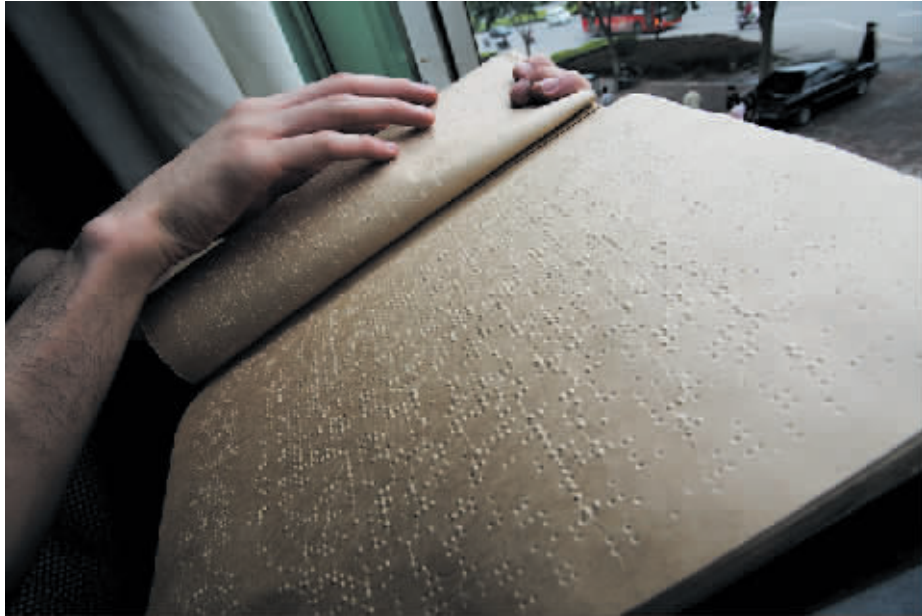
凹凸不平的盲文书籍,里面有他们认知世界内容。