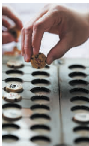
一盘棋会下很久,但他们说这样开发智力。