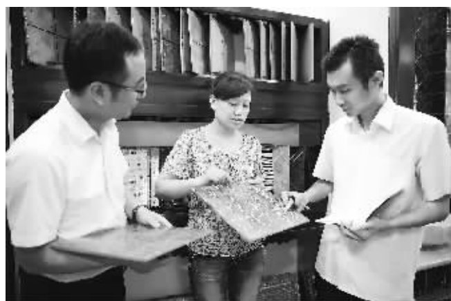
今年年初以来,市商业银行注重把小微企业贷款营销作为经营观念的突破点,构建银企信息沟通平台,为小微企业提供一系列“小微企业金融产品”,有力地支持了小微企业的发展。图为该行民主路支行客户经理在某瓷砖专卖店了解产品销售情况。李忠平 摄