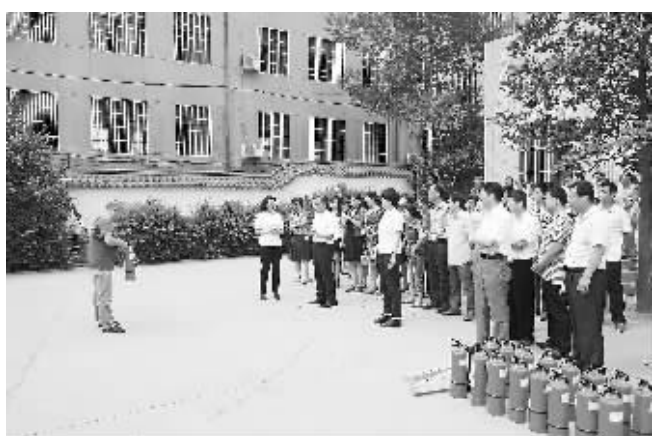
为了增强员工的消防意识,提高逃生自救能力,工行焦作分行于6月5日组织机关本部员工进行了消防疏散演练和灭火演练。通过演练,员工的安全消防意识有了显著增强,消防安全技能得到极大提高。