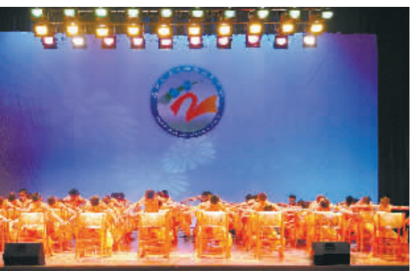
器乐合奏《鼓庆盛世》