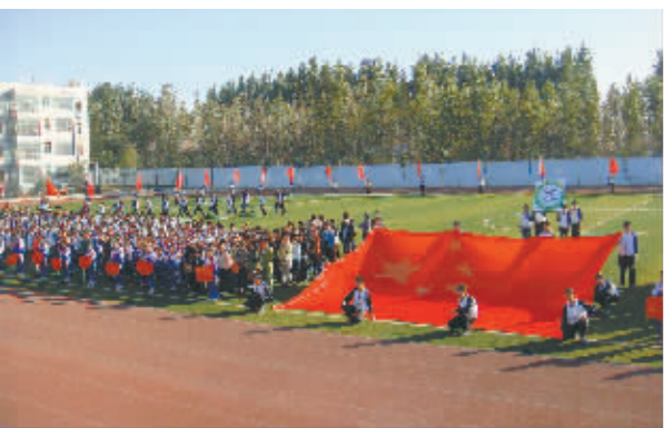
田径运动会开幕式