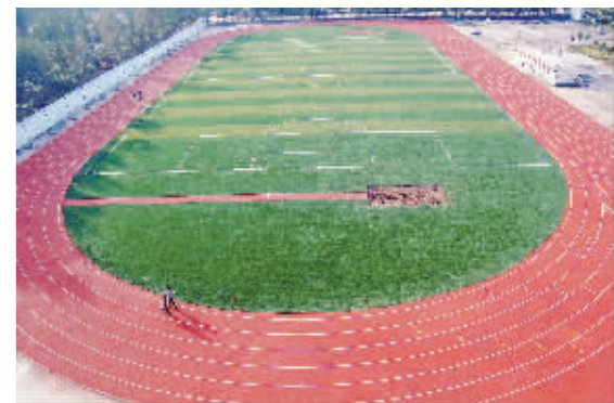
新建的运动场塑胶跑道