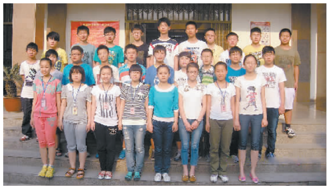
2013年在特色考试中被焦作一中提前录取的28名学生