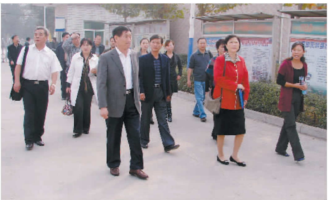
国家教育部艺术司领导到我校调研