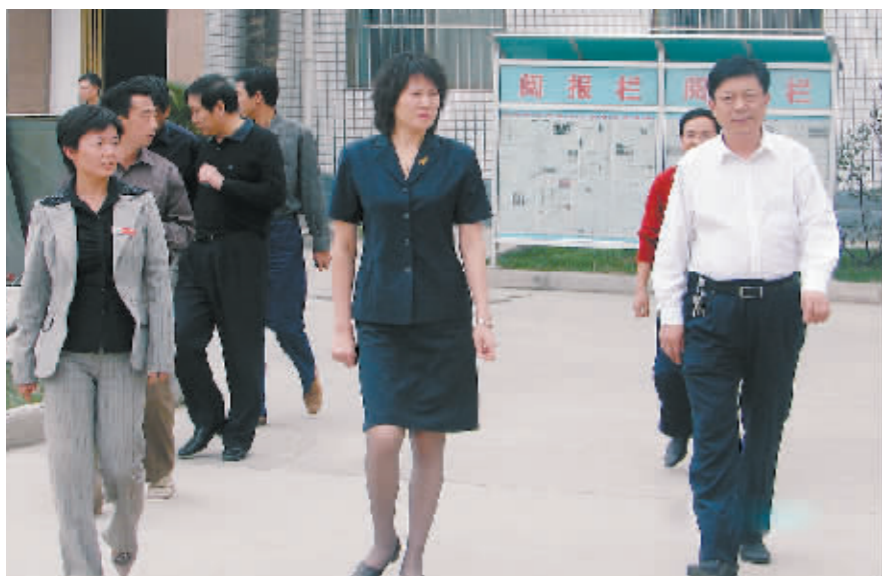
马村区委书记林宪振(右一)到我校视察工作