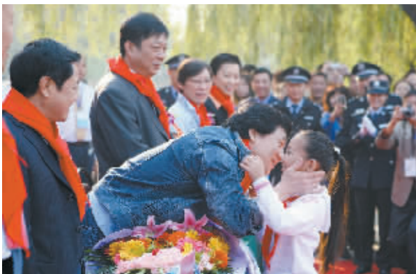
我校学生马习馨给成龙献花