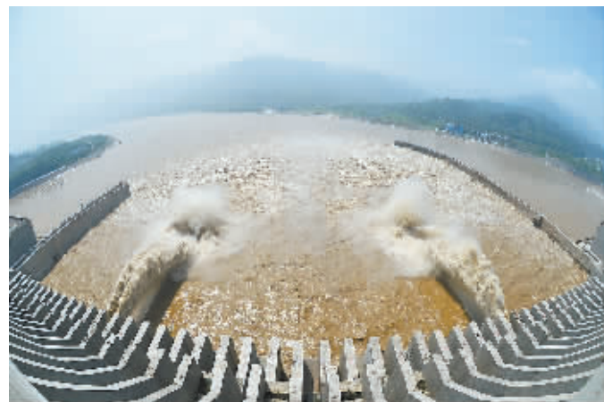
7月22日,江水通过三峡大坝泄洪深孔下泄。按长江防总调度,当日,三峡大坝今年首次开启2个泄洪深孔泄洪,以调整水库水位。(新华社发)