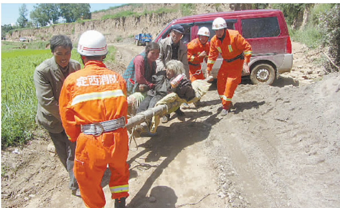
7月22日,在甘肃省定西市岷县梅川镇拉路村,来自岷县的消防员在转运地震中受伤的老人。

甘肃地震目前波及毗邻的陕西省,省会城市西安震感强烈,宝鸡、汉中、咸阳震感强烈,西安市高层房屋人群震感强烈。天水、白银等市州以及西安、成都等地均有明显震感。(均据新华社)