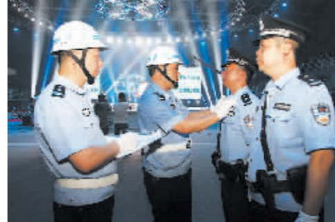
近日，央视《武林大会》走进陈家沟陈式太极拳总决赛举行，温县公安局制订周密的安保方案，出动近百名民警开展安保工作。图为该局督察民警在检查警容风纪。张建设 摄