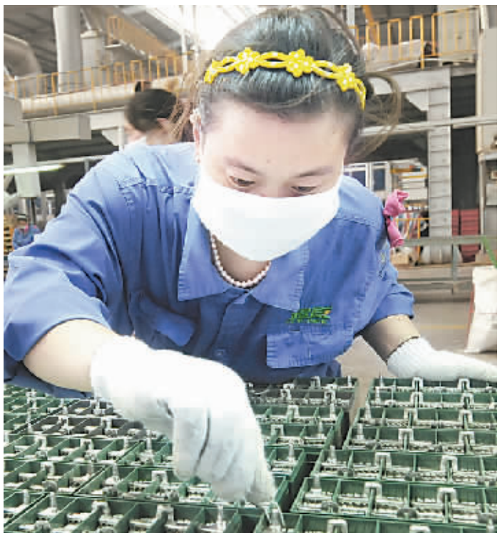
昨日,河南超威电源有限公司电池生产流水线上的工人正在紧张工作。该公司积极开发新产品,赢得客户信任,产品销售量不断上升,今年上半年实现产值16.6亿元。

最终,评委会将根据候选人的具体事迹,结合社会的投票结果及有关职能部门的综合评价,选出十佳2013河南“最美村官”,并予以表彰。