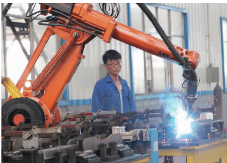
8月16日,在位于县产业集聚区的焦作市制动器有限公司,工人正在运用新引进的机器人完成焊接工作。近年来,该公司不断加大新技术研发力度,产品被国内众多大型知名企业和国家重点工程广泛应用。

会上,各相关部门汇报了各自承担重大项目和重点工作进展情况,与会领导对工作推进中存在的困难和问题进行了讨论研究。