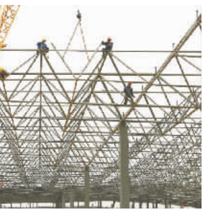
亚洲最大的汽缸套生产基地——中内配三期正在加紧建设

以思想转型为核心,堡垒坚强 提高班子队伍素质。首先,重视领导班子和干部队伍的思想政治教育,健全和完善党委中心组学习制度,坚持集中学习与自学相结合。其次,坚持民主集中原则,形成了领导班子“合心、合拍、合力”的良好氛围。 全面提升党的凝聚力。上半年,西虢、东容、西沃等13个村已通过一级村达标验收,顺润、梁庄、西容等7个村正在创建二级达标村。上半年新纳党员19名。 从源头上治理腐败。按照财务管理制度的要求,规范和完善“三资”代理服务,完善各村公开栏,21个村每季度按时公开本村财务管理和运行情况,接受群众监督。 落实“四联五服务”机制。严格按照“镇党员干部联系村级党组织、村党员干部联系村内党员、有能力党员联系农户”的要求,结合党员的特长和优势,从政策宣传、经济发展、和谐稳定、环境卫生、文化娱乐五个方面做好基层服务工作,确保群众问题事事有回音、件件有着落,党组织的创造力、凝聚力、战斗力得到持续提升。