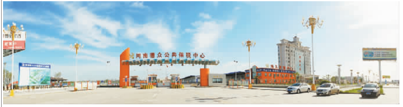
具有海关监管功能的河南德众公共保税中心