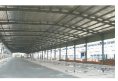
今年刚落成的豫农生物科技产业园项目