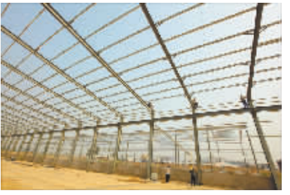
正在建设中的西虢镇中小企业园

建总投资28亿元的豫农生物科技产业园项目;新建总投资15亿元的新型节能环保发动机缸套、轴瓦项目;新建总投资6.8亿元的隆丰环保项目;新建总投资3.6亿元的孟州市锐鑫金属表面处理项目;新建总投资1.5亿元的长江大道拓宽项目;新建总投资2.8亿元的黄河大道拓宽项目;新建总投资1.2亿元的韩国东路项目。