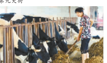
奶牛饲养基地带动农民增收致富