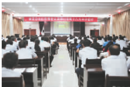
认真学习贯彻十八大会议精神。

博爱农信联社热心于各种公益事业,积极开展驻村帮扶活动,先后到孝敬镇北水屯村、东界沟村、齐村、坞庄村、大岩村等开展帮扶工作,累计捐款、捐物2万余元,受到村民欢迎。与博爱武装部开展军民共建活动,并看望慰问驻地官兵,被焦作市政府、