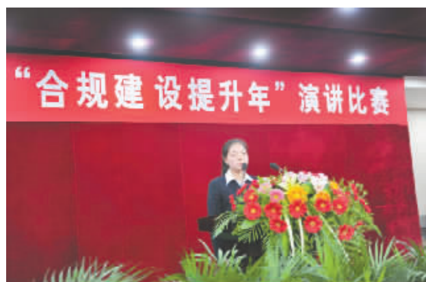
开展合规知识演讲比赛。