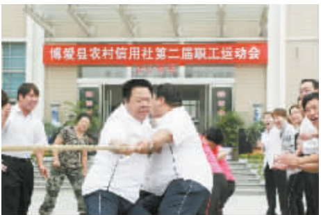
举办第二届运动会,丰富职工文化生活。

人生如诗,岁月如歌。近年来,博爱县农村信用合作联社把文明创建活动作为提升队伍素质和工作效能的强力抓手,坚持以人为本,不断加强干部职工素质教育。抓作风,转观念,创环境,树形象,努力打造文明和谐的服务型机关。抓文明创建,使博爱农信联社各项业务经营得到迅猛发展,迎来了该联社建社60多年来最美好的春天:先后被焦作市委、市政府授予纳税先进单位;焦作市拥军优属拥政爱民工作领导小组授予拥军优属拥政爱民工作先进单位;焦作市银行业协会授予2011年度焦作市银行业文明规范服务示范单位;博爱县委、县政府授予2012年度目标管理工作先进单位;中国共产党博爱县委员会授予2012年度全县统战工作先进单位;省纠风办授予该联社营业部群众满意基层站所等荣誉称号,多次受到省、市、县委和县政府的表彰奖励。博爱农信联社的事业,从文明创建中走向了辉煌。