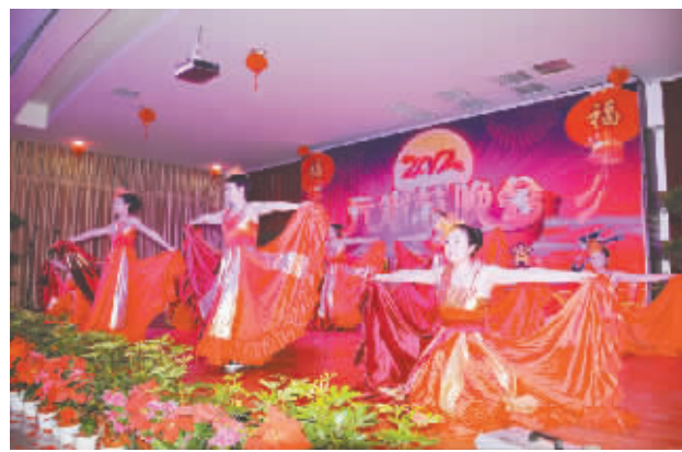
举办元宵节文艺晚会。