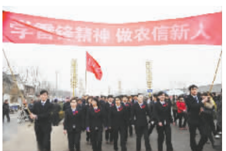
积极组织春季徒步走活动,大力弘扬雷锋精神。