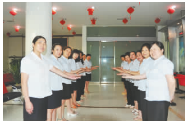
组织辖区内营业网点工作人员开展服务礼仪培训。

长风破浪会有时,直挂云帆济沧海。文明创建永无止境。祝兴金说:“尽管我们在精神文明建设中做了一些工作,取得了一些成绩,但较之新时期下文明创建的要求,仍有一些差距。我们将以此次省级文明单位创建为契机,继续不懈努力,不断创新,以更大的热情、更大的力度、更高的要求,扎实开展精神文明建设,争创一流业绩,为全面推进我社文明建设,全面实施四大战略作出新的更大的贡献。”