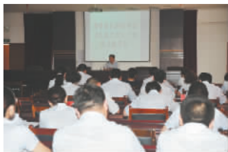
组织《失德之害》主题警示教育会。

2010年,博爱农信联社成功创建市级文明单位,成为该联社建社以来一个辉煌的里程碑。为了打造文明和谐的金融部门新形象,该联社多措并举不断提高领导班子和职工队伍的向心力、凝聚力和战斗力,组织中高层干部到红色根据地井冈山参观学习,树立共产主义的远大理想;参观焦作市领导干部廉政教育基地,开展反腐倡廉警示教育活