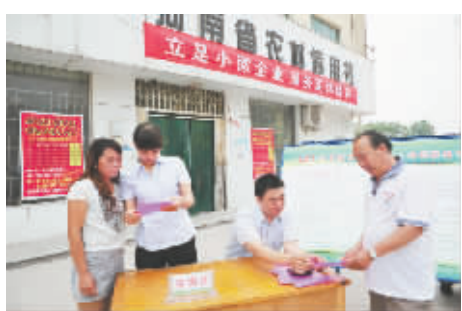
认真组织小微企业金融服务宣传月活动。