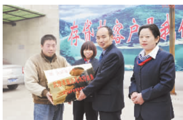
资金支持赢得客户青睐。