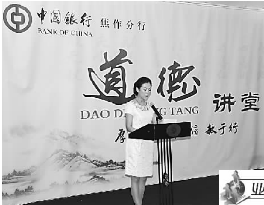
9月5日,中行焦作分行首期“道德讲堂”正式开讲,共设有唱歌曲、学模范、诵经典、谈感悟、发善心、送礼物6个环节。“道德讲堂”的成功开讲,使员工对“讲道德、做好人,树新风”有了更深刻的领悟。图为“道德讲堂”现场。