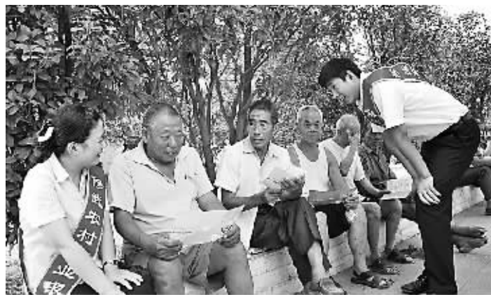
▲在“金融知识进万家”宣传服务月活动中,市商业银行按照省、市银监分局的统一安排部署,积极行动起来,结合本单位实际制订了具体的实施方案。图为该行焦东支行大堂经理正在向客户介绍金融知识。