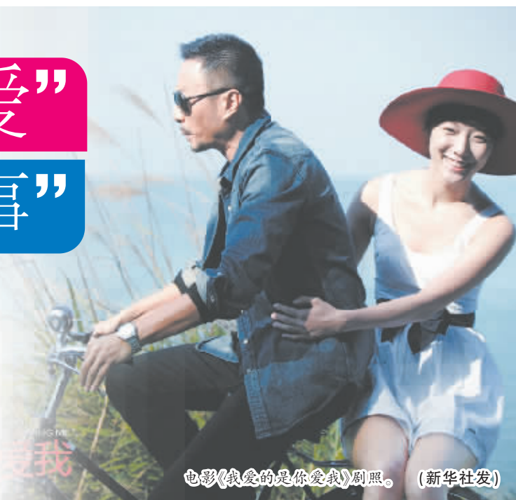
电影《我爱的是你爱我》剧照。

从目前的影片安排看,11月下旬将是进口片的天下。20日上映的《地心引力》和21日上映的《饥饿游戏2》都各有优势,而且同期上映的国产影片只有《控制》和《四大名捕2》值得一提。但细细分析,《地心引力》已经在全球累计票房收入接近3亿美元,不错的口碑、中国观众喜爱的3D效果和天宫空间等元素,都为其在争战11月份的电影市场奠定了基础。