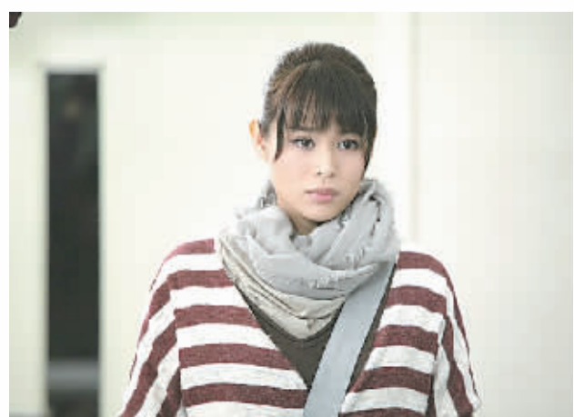
《金玉满堂》剧照。

导演丁晟29日在京介绍,作为华语电影经典警匪作品,成龙“警察故事”系列于1985年上映第一部,此次的《警察故事2013》是第六部,上一部则是2004年上映的《新警察故事》。