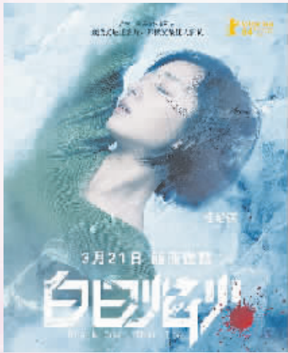
《白日焰火》海报。(本报资料图片)

不过,扎堆上映的女性题材影片虽多,似乎都没有表现出太好的卖相,反而是3月下旬上映的《白日焰火》最值得关注。