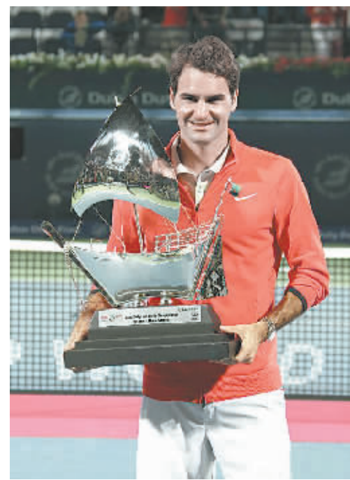
3月1日,在迪拜举行的ATP迪拜网球赛男单决赛中,瑞士选手费德勒以2:1击败捷克选手伯蒂奇,夺得冠军。图为费德勒展示冠军奖杯。