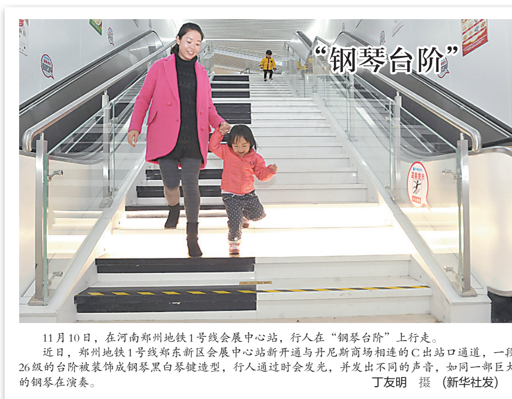
11月10日,在河南郑州地铁1号线会展中心站,行人在“钢琴台阶”上行走。 近日,郑州地铁1号线郑东新区会展中心站新开通与丹尼斯商场相连的C出站口通道,一段26级的台阶被装饰成钢琴黑白琴键造型,行人通过时会发光,并发出不同的声音,如同一部巨大的钢琴在演奏。

此次数据直播还反馈了网购中通过移动端无线支付的成交占比。数据显示,“双11”开场后无线支付占比一度高达80%,说明有许多预先做好功课的网购族早早地备好了购物车,只待时间一到,可能就在被窝里用手机、平板电脑完成了交易。此后,无线占比逐步下降,一小时后已降至45%左右。 0时38分,现场再次响起热烈的掌声和欢呼声,天猫“双11”成交额突破100亿元大关!相比前年的13小时、去年的近6小时,这次突破百亿元的速度令所有在场者大呼:“难以置信!” 一位满面通红的外国同行激动地告诉记者:“中国网民的购物能量太不可思议了,这种网购狂欢会改变全世界的消费。”(新华社杭州11月11日电)