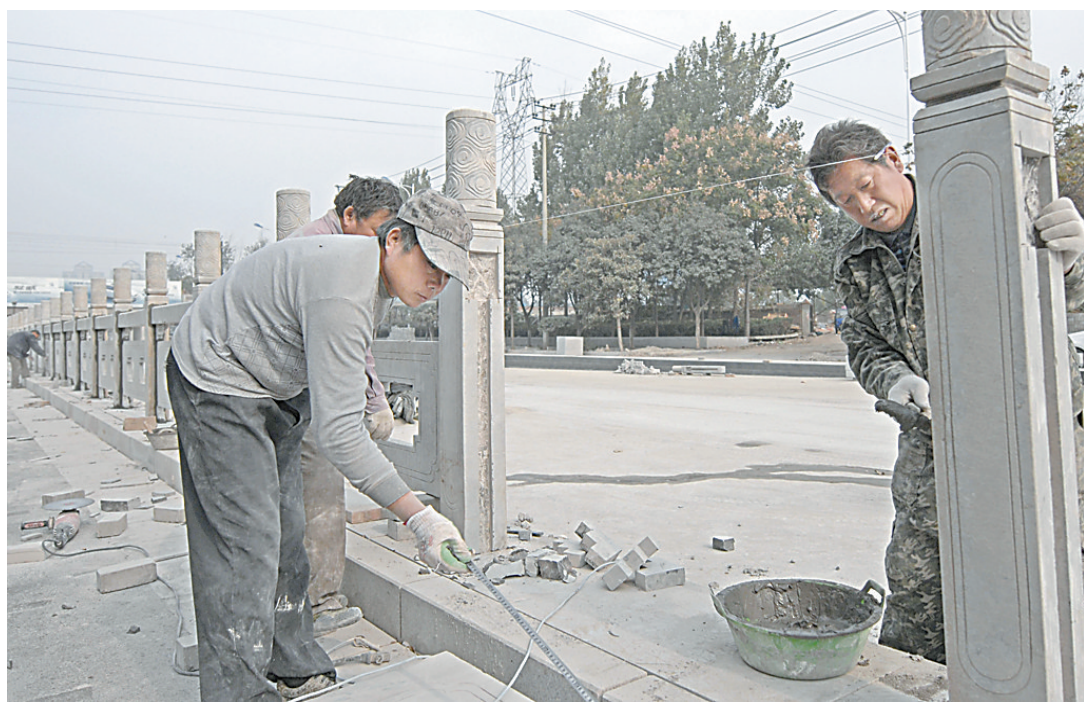
11月10日,普济路新月铁路桥西侧,工人正在安装护栏。据介绍,该工程全长514米,对原有铁质护栏进行更换,预计两侧护栏将在11月20日更换完毕。

新铺装、梁体裂缝处理、锚碇、基桩维护等。该桥建于2003年,由于交通量大及重载车辆反复碾压,造成桥面损坏严重,被市公路局列为今年的重点养护工程。自5月中旬进场以来,施工单位采用流水作业和平行作业的方式,实施全封闭施工,于10月底顺利完成主体工程。