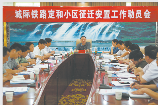
2012年9月4日，山阳区召开郑焦铁路定和铁路小区征迁安置工作动员会。