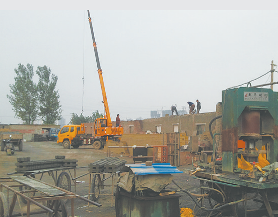
2012年10月16日，拆迁中的墙南村砖厂