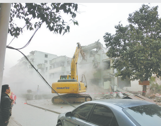
2013年2月20日，拆迁中的定和铁路小区现场。