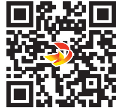
扫描二维码 看精彩视频

了解详情,广大读者和网友可登录焦作网 www.jzrb.com,进入“网络直播”点击收看,还可关注焦作网微信或扫描下方二维码收看本期节目。