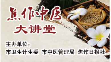
主办单位:市卫生计生委 市中医管理局 焦作日报社