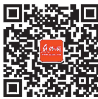
焦作网微信公众号