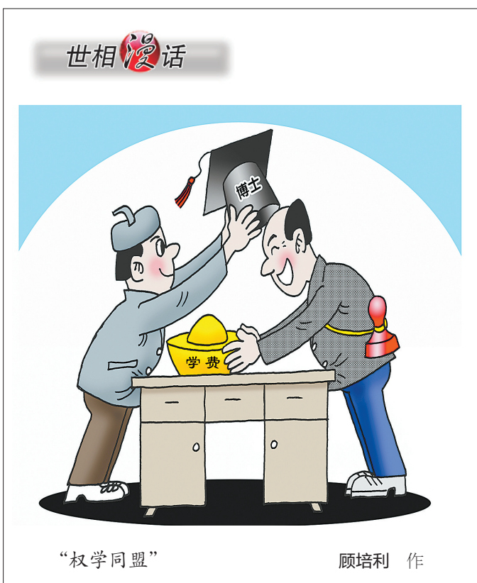
“权学同盟” 顾培利 作

两个都是为生活拼尽全力的普通人,都是服务行业的从业者,对彼此的艰辛显然有着更加深切的体会。事实上,对于很多人来说,都有自己的服务对象,也都在被其他行业的人服务着。服务他人时,我们要爱岗敬业,不能随意降低服务的质量与标准;被他人服务时,我们不能颐指气使,而应抱有最大的理解和宽容。如果我们不甘于现状、渴望成功,就要像外卖大哥和淘宝姑娘一样努力奋斗;即便有一天自己成功了,我们也要像淘宝姑娘善待外卖大哥一样,善待每一个人。