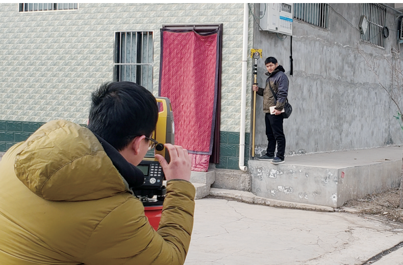
工作人员对房屋进行测量。

此项工作全面贯彻党的十八大和十九大精神,深入贯彻习近平总书记系列重要讲话精神和治国理政新理念新思想新战略,围绕现代农业强省建设,以深化农村集体产权制度改革为