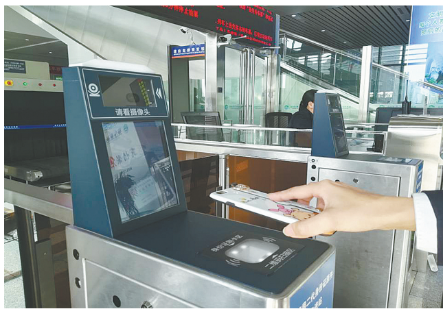
旅客模拟电子客票进站。

本报讯(记者赵改玲)记者昨日从焦作火车站了解到,今日起,郑焦城际铁路将和纸质票说再见,开始实施电子客票。具体是郑州城际焦作站、修武西、武陟、黄河景区、南阳寨、郑州站开始实施电子客票。旅客通过互联网订购车票以后,无须换取纸质车票,可直接持二代身份证等有效身份证件或者刷购票二维码,通过火车站进站口和验票闸机乘车。 电子客票通过网上购买,也可以通过人工窗口和自动售票机购票。购买铁路电子客票的旅客,凭购票时所使用的乘车人有效身份证件原件,通过人工通道完成实名制验证、进出站检票手续。 持电子客票如何验票乘车?使用购票时所使用的有效身份证件原件进站乘车。同时,也可以通过12306手机客户端生成的电子客票动态二维码(首次使用需通过人脸核验)对准闸机上的二维码识读装置,即可完成扫码验票乘车。 如何打印电子客票报销凭证?旅客可以在开车前或乘车日期之日起30日内,凭购票时使用的有效身份证件原件到车站售票窗口(含自动售票机)打印电子客票报销凭证;超过30日的,可联系铁路12306客服中心办理。电子客票报销凭证作为税务部门认证的有价票据,只能办理一次报销。因此,建议旅客根据需要凭凭证打印报销凭证并妥善保管,防止遗失。 电子客票也可以到车站指定窗口办理改签、退票手续。需要注意的是,在12306网站办理改签、退票,不要晚于开车前30分钟;办理变更到站,不要晚于开车前48小时。 购买学生票、残疾人票的,在首次办理购票、取票业务时,需要到车站指定窗口核实身份,并通过自动识读或手工输入购票身份证件信息方式完成优惠资质采集关联工作。持这两类优惠票的旅客,应当在开车前办理核验手续后进站乘车。