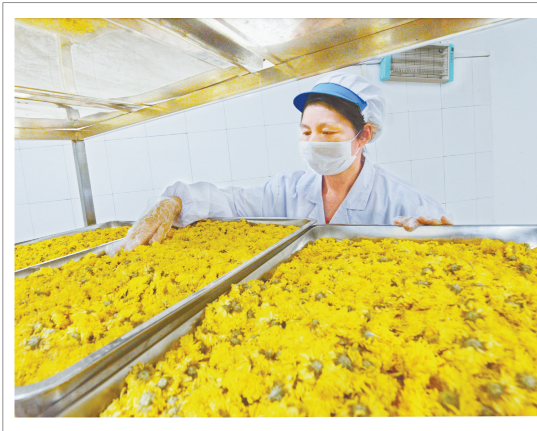
11月26日,市太极庄公司工人在加工怀菊花茶。该公司是一家集种、产、销为一体,形成完整产业链的企业,先后研发出11大系列300多个怀药产品,有70多公顷“四大怀药”产业种植基地、5个购物中心和1个怀药特产深加工工厂。近年来,该公司利用旅游开发,把“四大怀药”推向了全国。